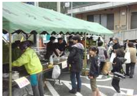
昨年のバザーの様子(写真3枚)