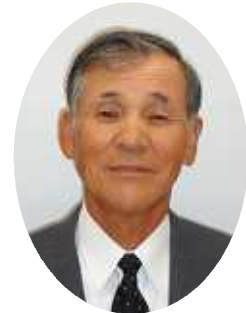
社会福祉法人 奥多摩町社会福祉協議会